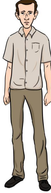
Orhan Veli (beden)

Hikâyeyi ilk kez 2011 yılında okudum. Film yapmaya niyetlenmem, senaryolaştırma ve ilk taslakların çıkması yıllar içinde gerçekleşti. Ancak tüm bu süreç, mart ayında pandeminin başlaması ve eve kapanmayla geçen 8 ayın ürünü diyebilirim.