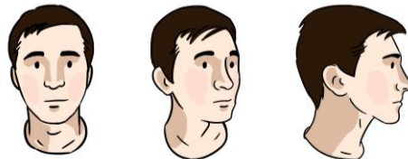
Genç Şair (taslak)

Animasyonun ön hazırlığı için en önemli nokta doğru planlanmış bir animatiktir aslında. Storyboard için çizdiğim kareleri, sürelerini göz önüne alarak arka arkaya yerleştirip, seslendirmeye birleştirip filmin ön izlemesini gerçekleştirdim. Animatik sayesinde sahneyi ve sekansları kafamda daha rahat planladım. Her planın süresi, kaç kare çizmem gerektiği, hareketlerin ritmi buna göre oluştu.